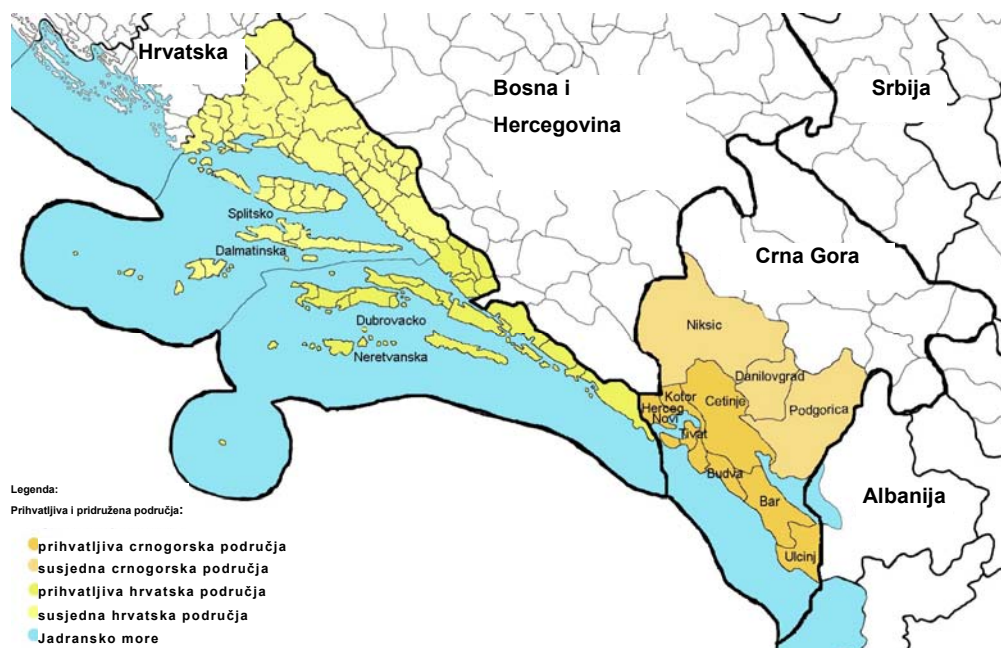
Karta 1: Prihvatljiva i pridružena područja za Hrvatsku i Crnu Goru